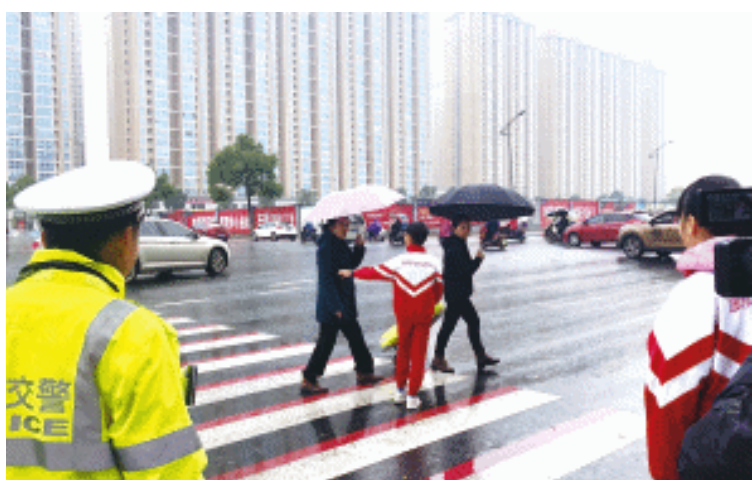
昨日, 在开元路时中路口, 中南小学六年级学生在长沙县交警大队湘龙中队民警带领下, 劝阻行人闯红灯、驾驶员不减速让行等违法行为。

交警告诉记者, 之所以邀请小学生当“小交警”, 一是希望通过自身体验, 从小树立孩子们的遵纪守法意识, 进而影响到身边更多人, 二是小孩子的劝阻, 成年人更容易接受, 印象也更加深刻, 效果更好。